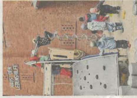
Mit Spielen und kreativen Herausforderungen werden die Kinder gefördert.