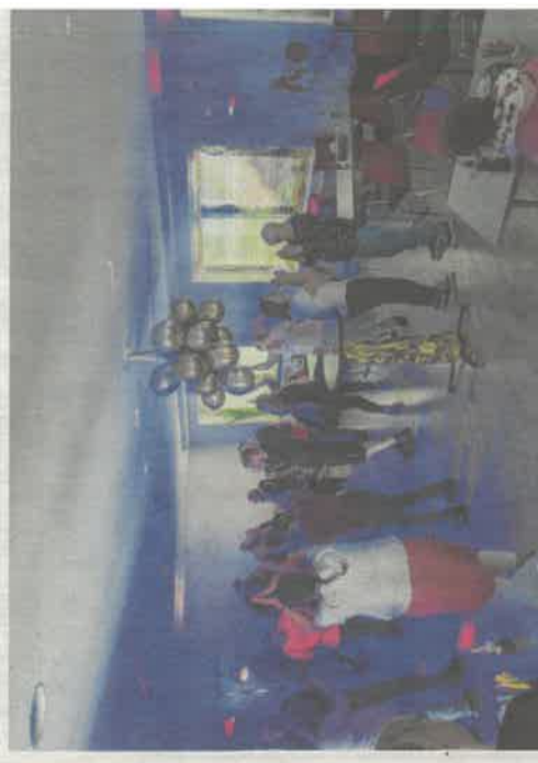
Im Mai fand im Treffpunkt Mensch eine Dielra statt